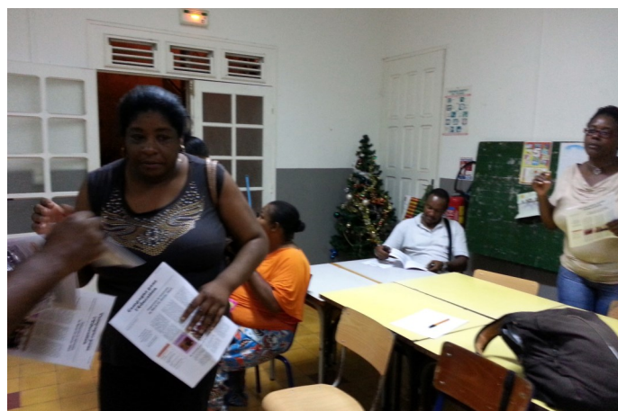
La salle de réunion de l'Association Passerelle