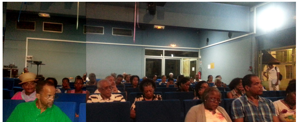
Des participants intéressés et soucieux de faire des propositions pour avancer